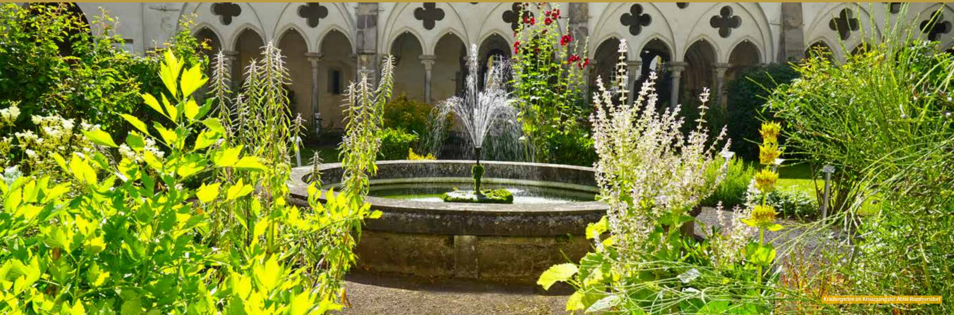
Kräutergarten im Kreuzgang der Abtei Rommersdorf